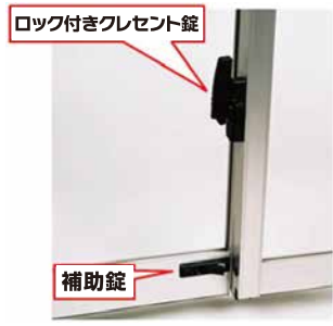
ロック付きクレセント錠