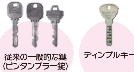
従来の一般的な鍵(ピンタンブラー錠)