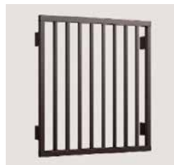
一般的なアルミ製は避ける