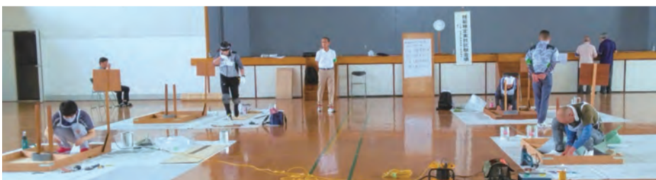
全員が早々に作業を終えた床プラスチック系作業